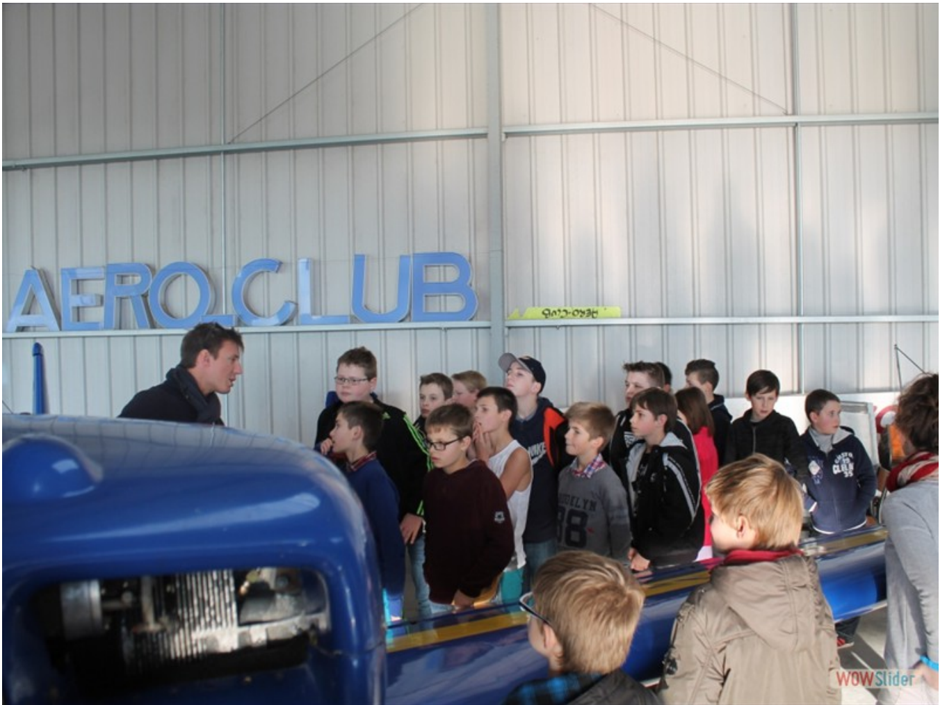
Dans l'académie, plus de 400 élèves (dont 25% de filles) sont inscrits au BIA.